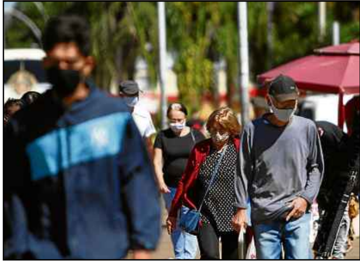
Até o momento, 208.668 pessoas se recuperaram da covid-19