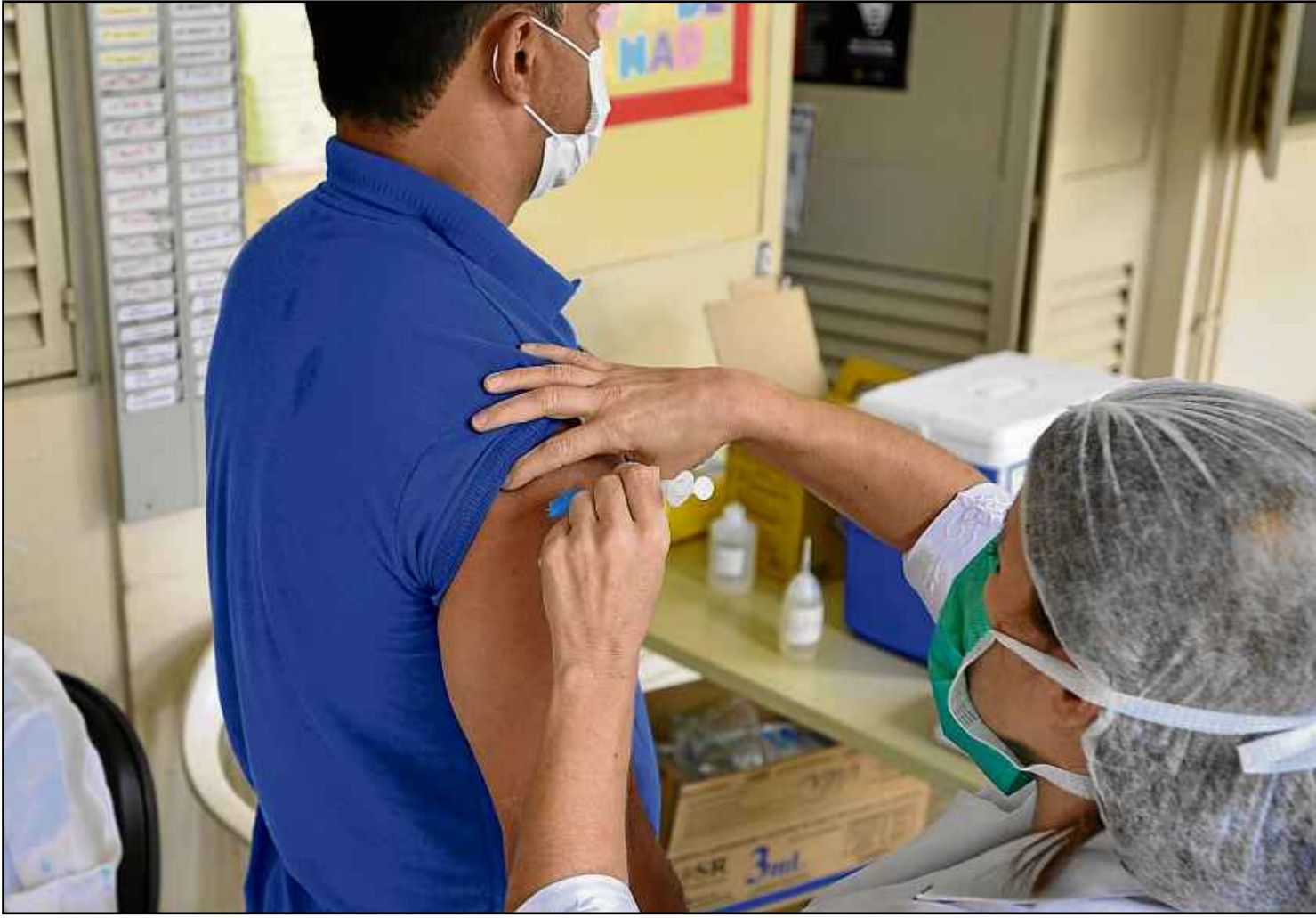
Campanha de vacinação contra o sarampo vai até 27 de novembro. Meta é imunizar 95% da população adulta do DF

(primeira dose) e 59,3% (segunda dose). A aplicação da segunda dose da tríplice viral (sarampo, caxumba e rubéola) só foi instituída no calendário de vacinação a partir de 2004. Por isso, agora, quem nasceu antes desse período é alvo da campanha pela dose extra.